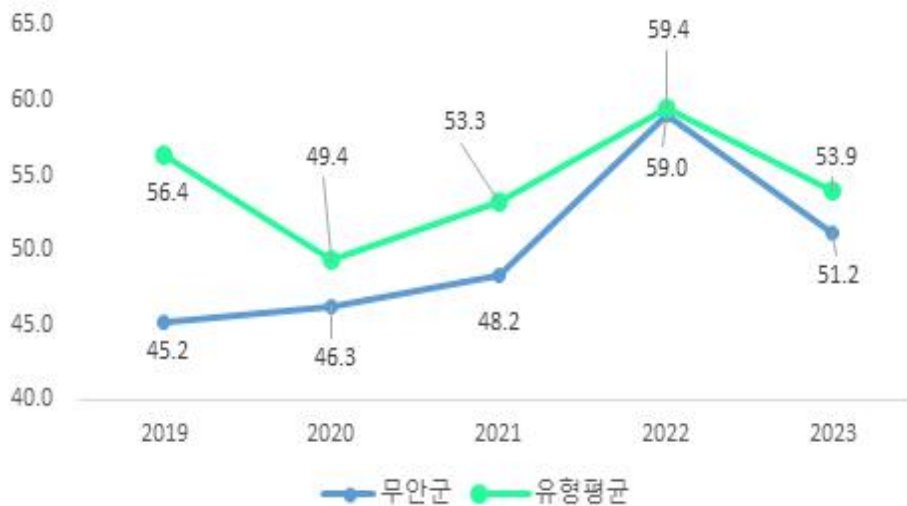
최근 5년 결산기준 재정자주도