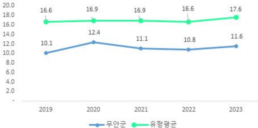
최근 5년 결산기준 재정자립도

※ '자체세입', '보전수입 등 및 내부거래' 및 '세입 합계'의 각 수치는 결산액에서 '전년도 이월 사업비'를 제외한 값입니다. 예산 기준 재정자립도 산정시 전년도 이월 사업비가 포함되지 않기 때문에 지표 간 비교를 위해 이를 제외하였습니다.