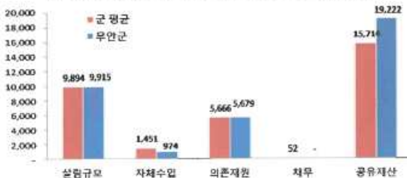
유사자치단체 살림살이 규모비교 (단위: 억원)