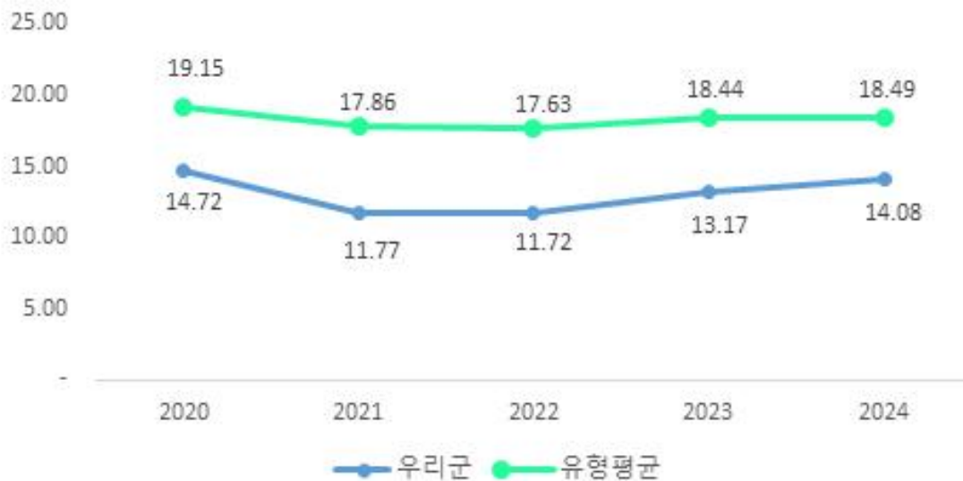
최근 5년 재정자립도

우리군의 재정자립도는 최근 증가 추세이나 동일 지자체 유형평균에 비해서는 낮은 편입니다.